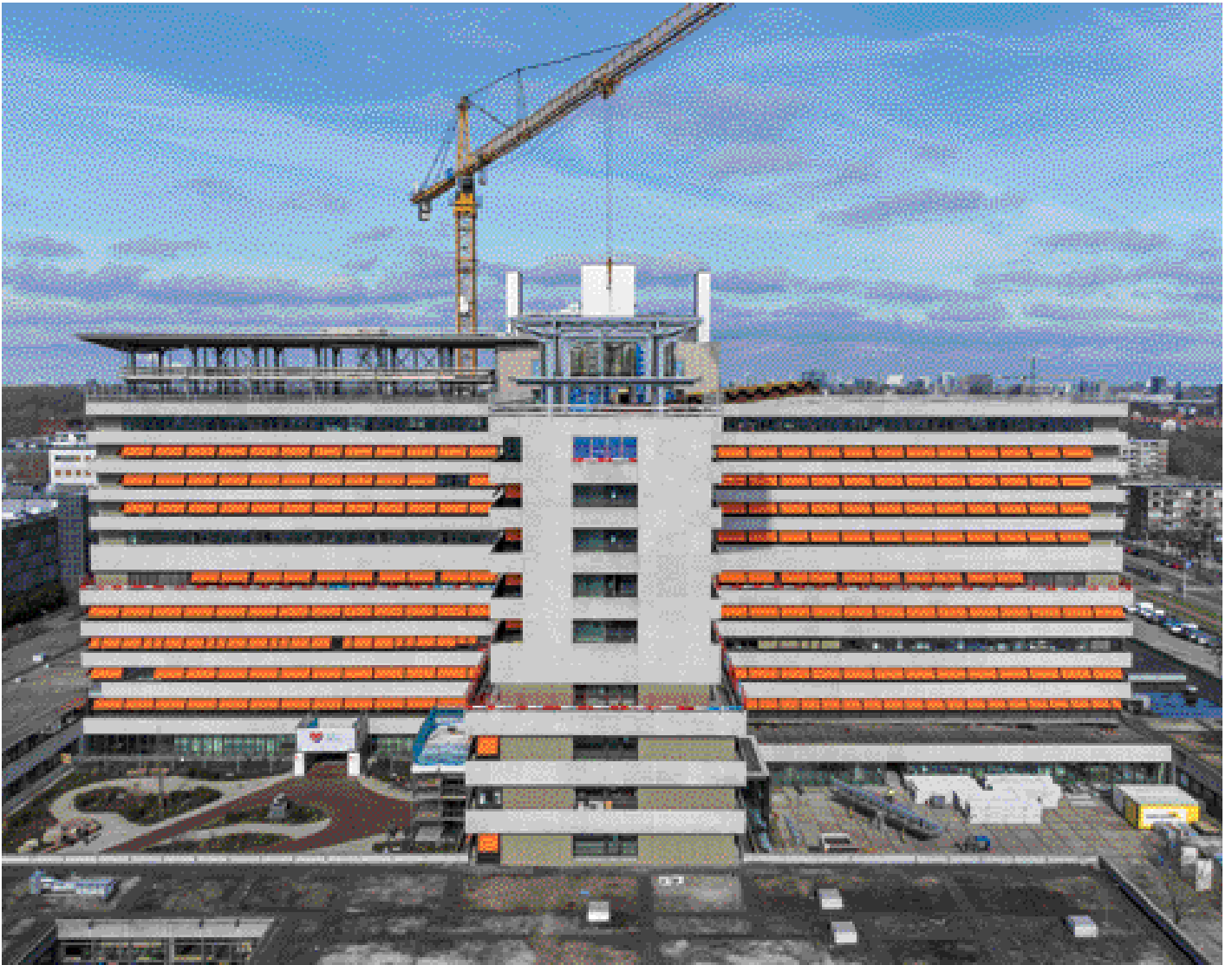
1. Tweelaagse optop. Rechtervleugel nog zonder staalconstructie.

Het voormalige Slotervaartziekenhuis wordt getransformeerd naar Het Slotervaart. Opdrachtgever Zadelhoff laat op het gebouw, een betoncascos met tien bouwlagen, een optop van twee lagen met een uitkragende dakrand plaatsen, naar ontwerp van MVSA Architects. De bedrijfsvoering in het gebouw gaat door, vandaar dat het constructieve ontwerp uiteenvalt in twee delen: de constructie van de optop en het steigerwerk, dat afsteunt op de stalen kolommen van nieuwe spanten. Oplevering staat eind dit jaar gepland.